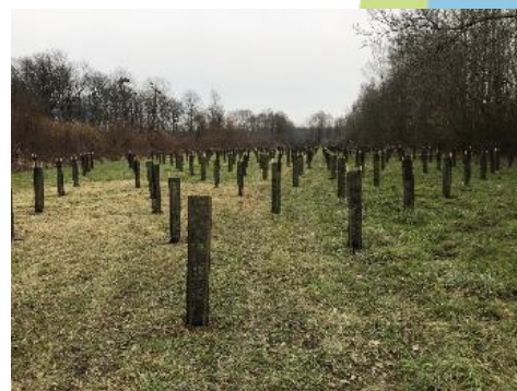
Plantations à Chiry-Ourscamp (60)

La signature de cet arrêté d'autorisation environnementale ouvre la voie aux premiers travaux du Canal Seine-Nord Europe. Ils s'engageront progressivement à partir de ce printemps, en particulier par la réalisation de deux giratoires à Choisy-au-Bac et Ribécourt-Dreslincourt, puis de deux quais à Ribécourt-Dreslincourt et Pimprez cet été, avant des travaux plus conséquents à partir de l'automne. Sur ce secteur de 18,6 kilomètres dans l'Oise, les aménagements environnementaux comprennent 391 ha de sites écologiques créés et restaurés. Le chantier de ces aménagements a d'ores et déjà commencé. Après les premiers aménagements de Bienville en 2017 ; la plantation au mois de mars de plus de 6 500 arbres, dont des Ormes lisses, une espèce protégée dans les Hauts-de-France, sur une parcelle de 5,4 hectares a été réalisée à Chiry-Ourscamp dans l'Oise (voir reportage sur le site du Canal Seine-Nord Europe). 17 autres sites vont être progressivement aménagés dans la vallée de l'Oise.