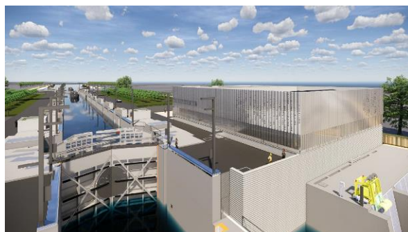
Vue de l'écluse de Montmacq

Les travaux consistent en l'aménagement de l'Oise puis d'un nouveau canal entre Compiègne et Ribécourt-Dreslincourt et ensuite en l'élargissement du canal actuel jusque Passel. Côté ouvrages d'art , le secteur 1 prévoit la construction d'une écluse de près de 200 mètres de long à Montmacq, de 3 quais de transbordement à Thourotte, Ribécourt-Dreslincourt et Pimprez et de 7 franchissements routiers. C'est également l'aménagement de 11,5 km de berges lagunées et 391 hectares de plantations et d'aménagements environnementaux (roselières, mares, prairies humides).