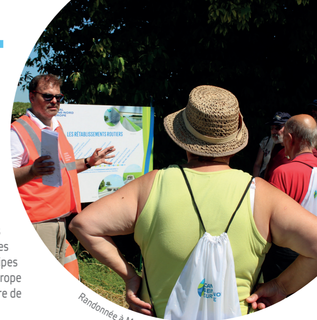
Randonnée à Mœuvres le 24 juin dernier

Découvrez le film « L'environnement au cœur du Canal »