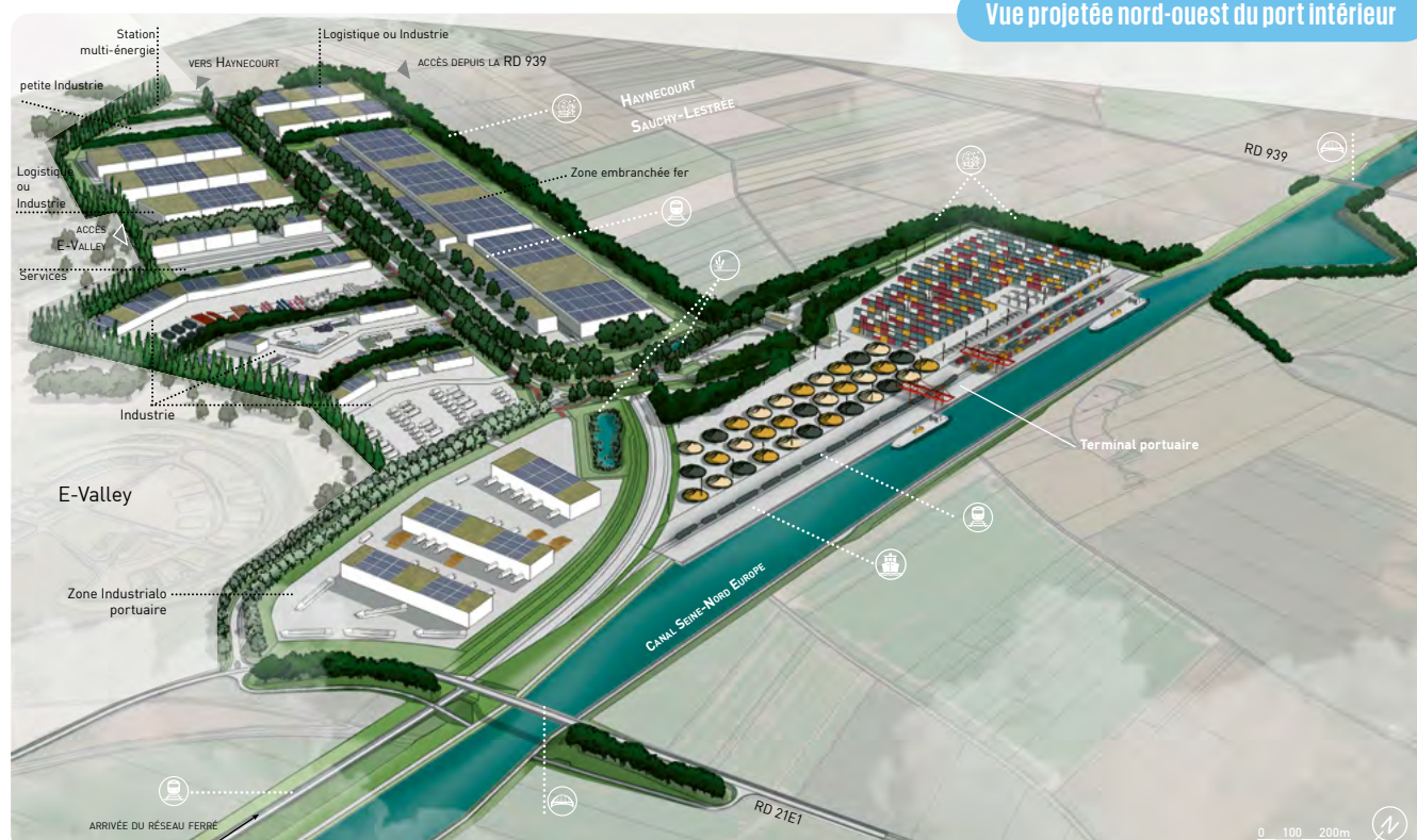
Vue projetée nord-ouest du port intérieur

Le transbordement des marchandises s'effectuera au niveau du quai long de 1000 mètres, via les modes de transport routier mais aussi ferroviaire grâce à une connexion à la ligne Douai-Cambrai, en cours d'étude.