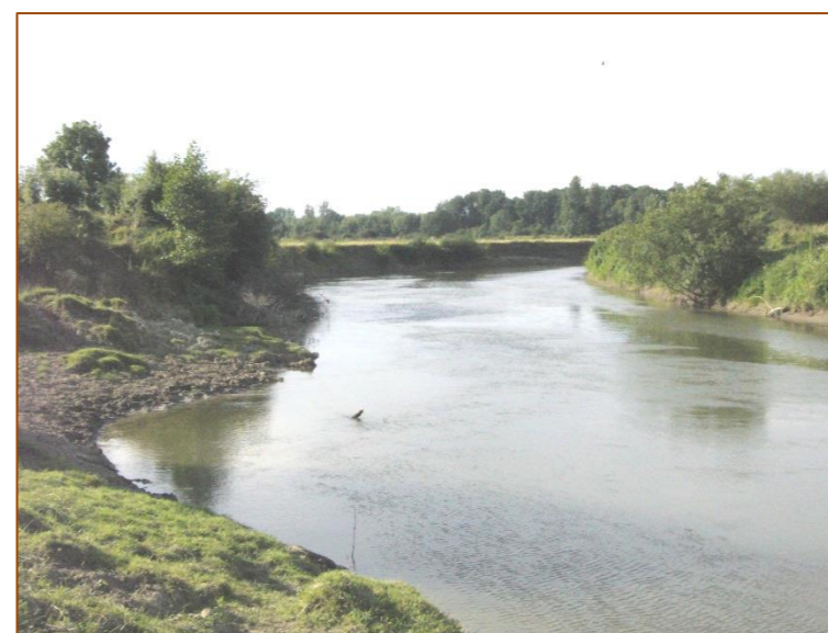
Illustration 8 : L'Oise en amont de Sempigny en étiage

Pour des sécheresses exceptionnelles, des économies d'eau peuvent également être réalisées grâce à des restrictions de navigation (abaissement de la ligne d'eau de 0,5 à 1 m, diminution éventuelle de la largeur du rectangle de navigation, puis de l'enfoncement des bateaux entraînant une modification temporaire du gabarit). Au-delà d'un abaissement du NNN d'un mètre, la navigation est interrompue.