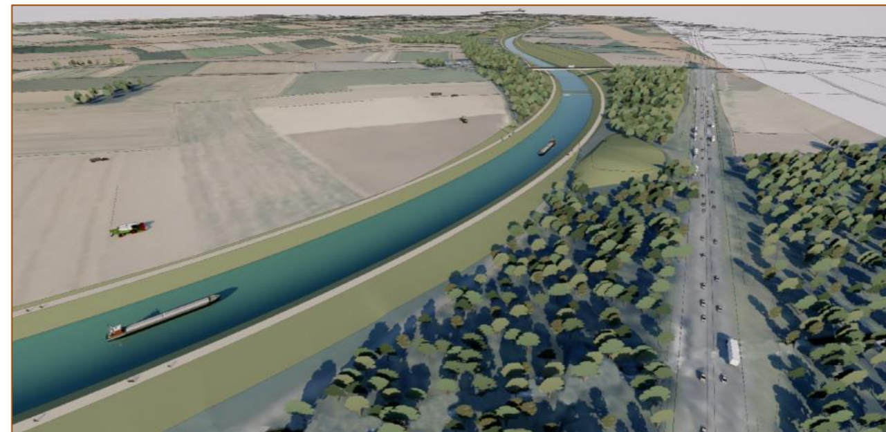
Illustration 2 : Vue du bief 5 près d'Havrincourt, avec autoroute A2

Ce dossier sera constitué dès le début de la construction de l'ouvrage par chaque maître d'œuvre secteur et mis à jour régulièrement. Il doit être conservé dans un endroit accessible (zone hors crues) permettant son utilisation en toutes circonstances. Un exemplaire sera obligatoirement conservé sur support papier par l'exploitant.