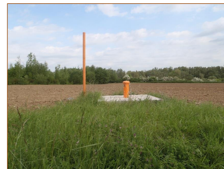
Illustration 10 : Piézomètre R2B (réalisé en 2013) avec canal de la Sensée au lointain

In fine, une partie de ces piézomètres seront conservés pour effectuer le suivi des incidences du projet en phase chantier et en phase exploitation.