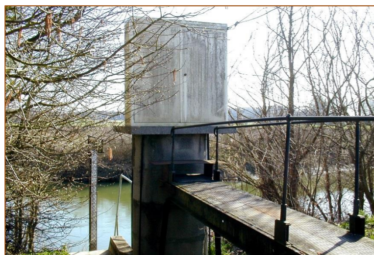
Illustration 7 : Echelle annonce de crue sur l'Oise à Sempigny

En cas de crue courante, le secteur 1 fonctionnera globalement sans intervention sur des organes mobiles, quel que soit l'état considéré (phase 1 ou 2 de travaux, phase de fin de construction du secteur 1 avec ou sans