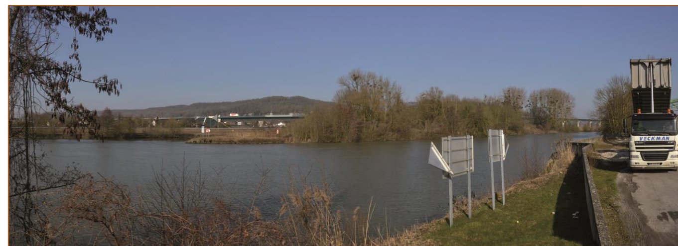
Illustration 9 : Confluence Aisne Oise