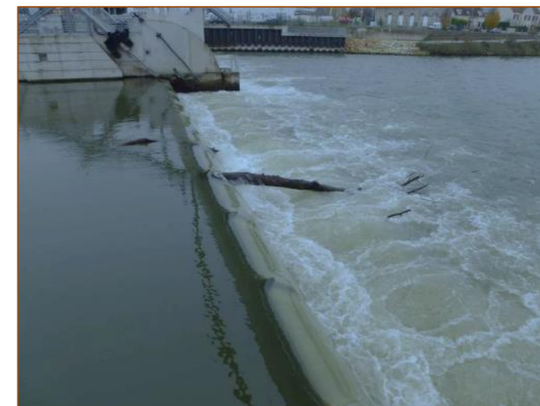
Illustration 5 : Barrage de Venette. Aperçu de la passe centrale

Ce document est établi au minimum une fois par an pour les ouvrages de classe A, une fois tous les trois ans pour les ouvrages de classe B, une fois tous les cinq ans pour les ouvrages de classe C. Cette périodicité doit être cohérente avec celles précisées par arrêté préfectoral.