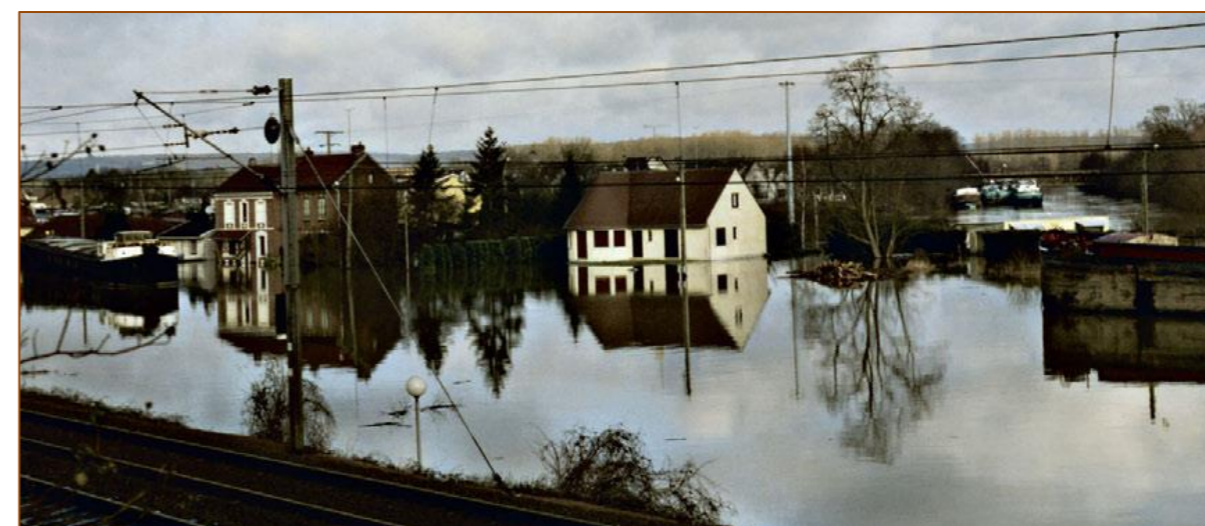
Illustration 3 : L'Oise, pointe aval de l'île de Janville