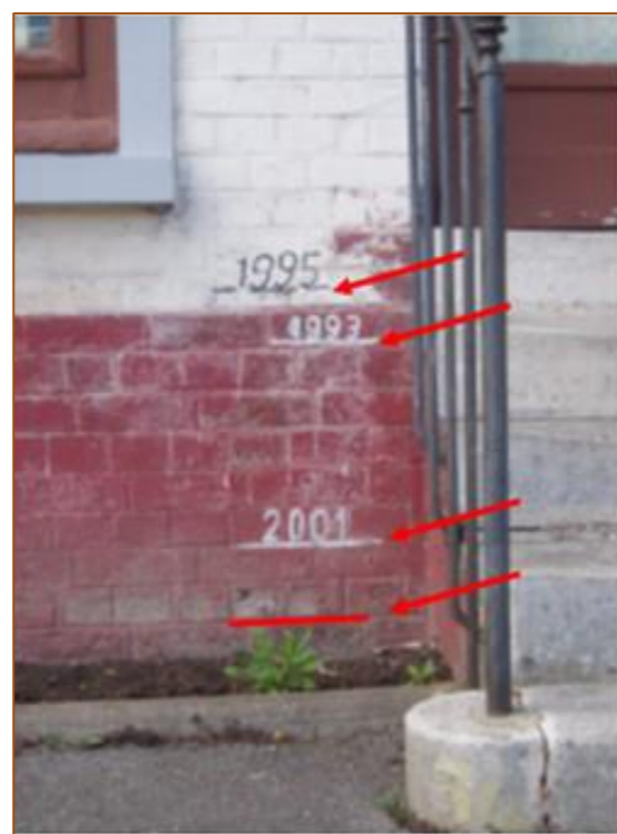
Illustration 4 : Laisses de crue. Avenue de la canonnière à Janville