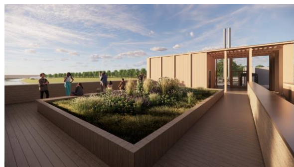
L'écluse de Noyon visitable @ONE-AEI-SCSNE