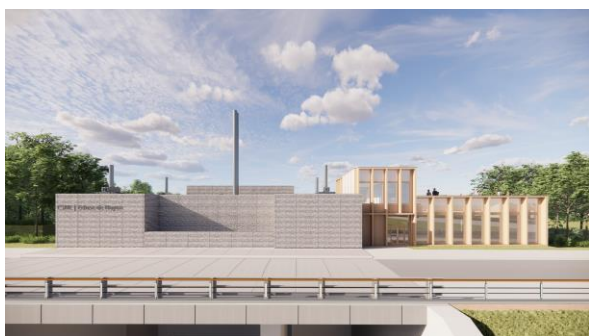
Perspective de l'écluse de Noyon

Le site éclusier de Noyon fera l'objet d'autres marchés qui seront lancés ultérieurement : équipements, bâtiment et aménagements paysagers. Un sourcing et une concertation anticipée avec les entreprises ont permis de définir cet allotissement, dans un objectif d'accès des PME. Le travail de sourcing avec les fédérations professionnelles se poursuit notamment pour la mise en place d'un cadre contractuel pertinent et équilibré pour ce type de chantier. Il sera ensuite décliné, pour les marchés de travaux principaux (dont les marchés des écluses), dans les DCE remis aux candidats sélectionnés pour la phase « offres ».