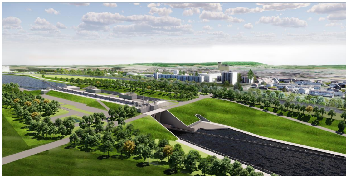
Vue paysagère de l'écluse de Noyon

C'est une nouvelle étape pour les écluses du Canal Seine-Nord Europe, l'avis d'appel public à la concurrence concernant les travaux principaux et les prestations associées nécessaires à la réalisation de l'écluse de Noyon dans l'Oise vient d'être publié. Cette étape permet aux opérateurs économiques de se porter candidats d'ici le 11 mars 2025 sur la base du dossier de consultation des entreprises spécifique à la phase « candidatures » joint à l'avis de marché. La notification de ce marché est prévue pour l'été 2026. Le lancement de ce marché est un signal concret d'accélération du Canal Seine-Nord Europe en ce début 2025, et la SCSNE s'apprête à publier cette année plus d'une vingtaine de consultations en vue de l'attribution de marchés de travaux, dont les marchés principaux.