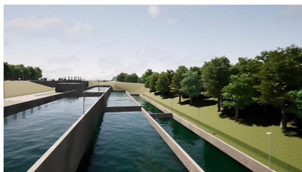
Bassins d'épargne de l'écluse de Noyon