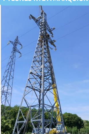
PYLÔNES RTE À MARQUION