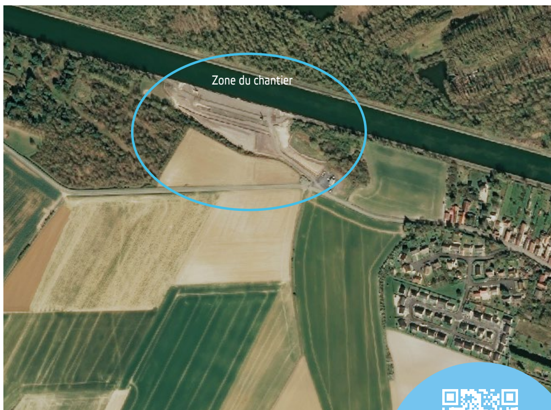
Le chantier du quai travaux d'Aubenchoul-au-Bac en avril 2025

Pour la SCSNE, cette innovation permet par exemple le recensement des boisements et des haies dans le périmètre d'emprise du projet ou le suivi des opérations de terrassement ou d'avancement des ouvrages. Ces nombreuses applications à imaginer projettent le secteur de la construction dans l'ère du numérique et de l'intelligence artificielle.