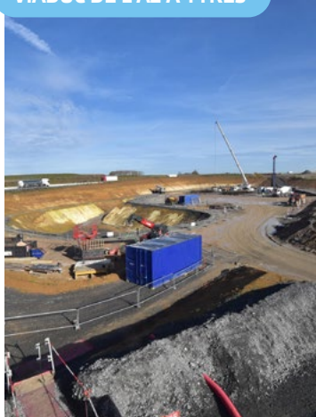
VIADUC DE L'A2 À YTRES

PLUS D'INFOS DANS LA RUBRIQUE ACTUS DU SITE WEB