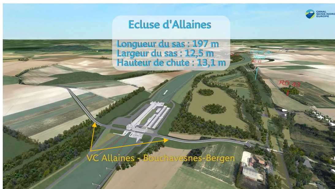
Extrait de la présentation du Canal en 3D sur le secteur 3

Pour ce marché, la préparation du chantier se fait sur 4 mois, et les travaux débiteront dans le courant du 1 er semestre 2026 pour une durée de 2 mois.