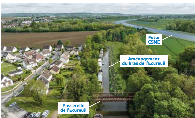
Aménagement du bras de l'Écureuil

L'ancien bras de l'Oise dit « bras de l'Écureuil » sera, lui, partiellement aménagé en zones humides mêlant habitats naturels (roselière, prairie humides et boisement alluvial) et habitats spécifiques favorables au Martin pêcheur pour favoriser la diversification de la biodiversité. Cet aménagement permettra aussi, au terme d'une concertation avec les résidents, de maintenir une zone en eau pour le stationnement des bateaux logements.