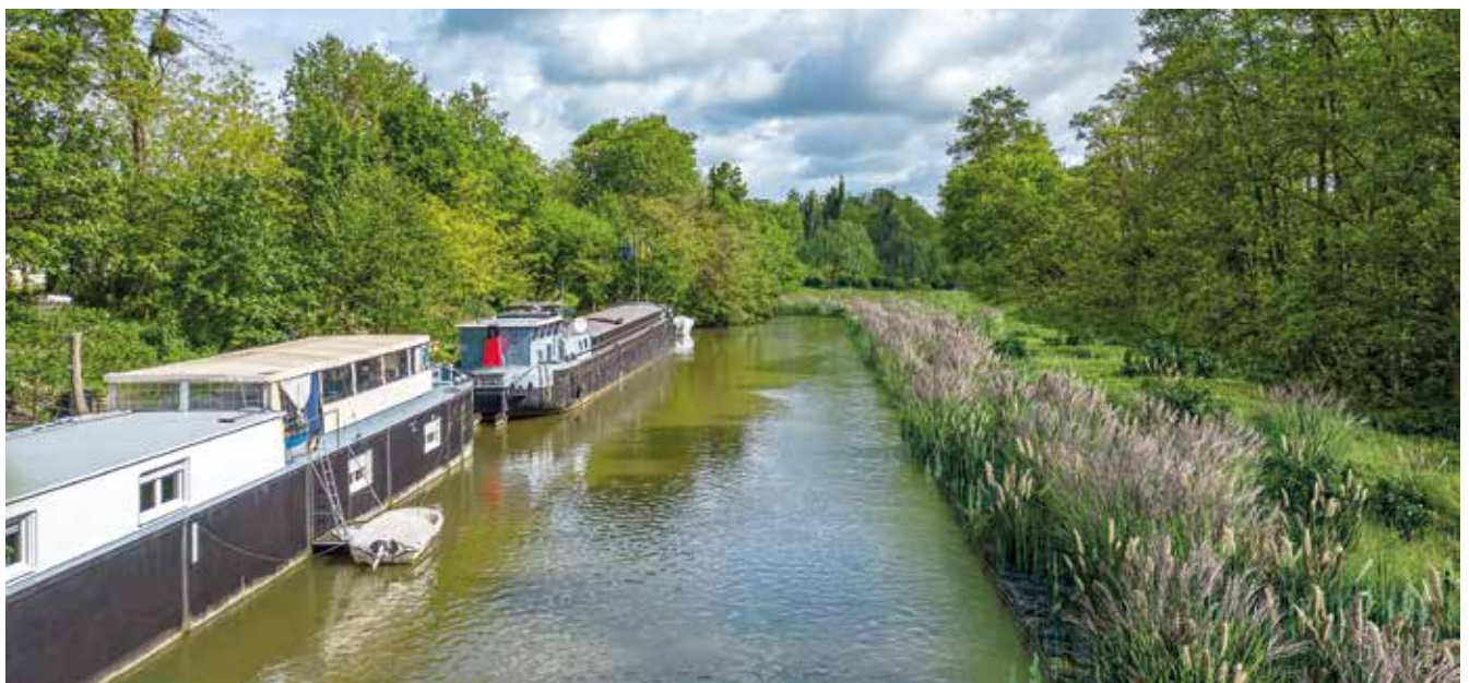
Vue projetée de l'aménagement depuis la passerelle de l'Écureuil

La définition de cet aménagement et les modalités de déplacement provisoire des bateaux-logements, nécessaire pour la réalisation des travaux, ont fait l'objet d'une concertation avec les occupants, en lien étroit avec la Mairie de Longueil-Annel et Voies navigables de France.