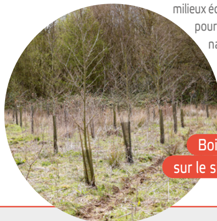
Boisements sur le site du Pont-Canal

À partir de septembre 2026, les travaux commenceront dans la vallée de l'Ingon, à Herly, Curchy et Nesle. Sur 16,4 hectares, plusieurs milieux écologiques seront aménagés pour conforter le rôle de corridor naturel de cette vallée et favoriser le développement de la biodiversité locale.