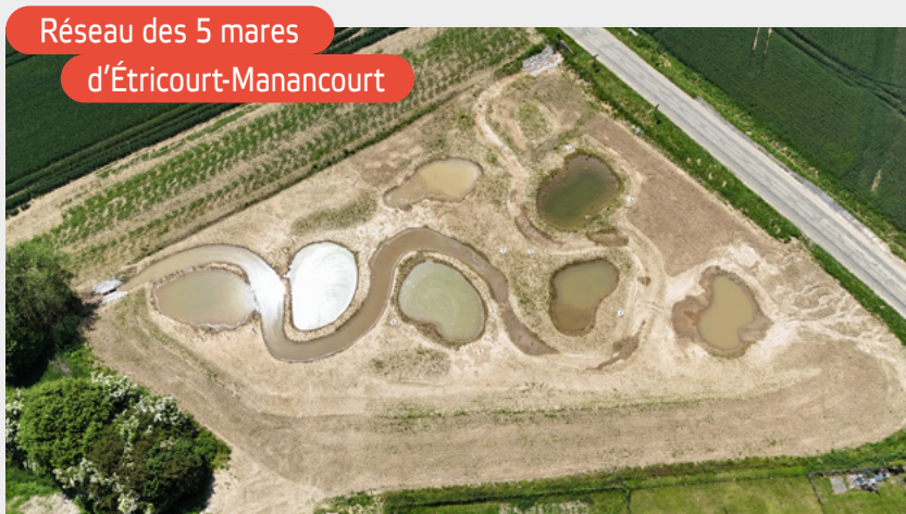
Réseau des 5 mares d'Étricourt-Manancourt

Après les travaux, une année sera consacrée à l'évolution naturelle du site. Les mares seront ainsi pleinement fonctionnelles au printemps 2027, pour accueillir les espèces transférées lors des opérations de sauvegarde prévues avant les grands travaux.