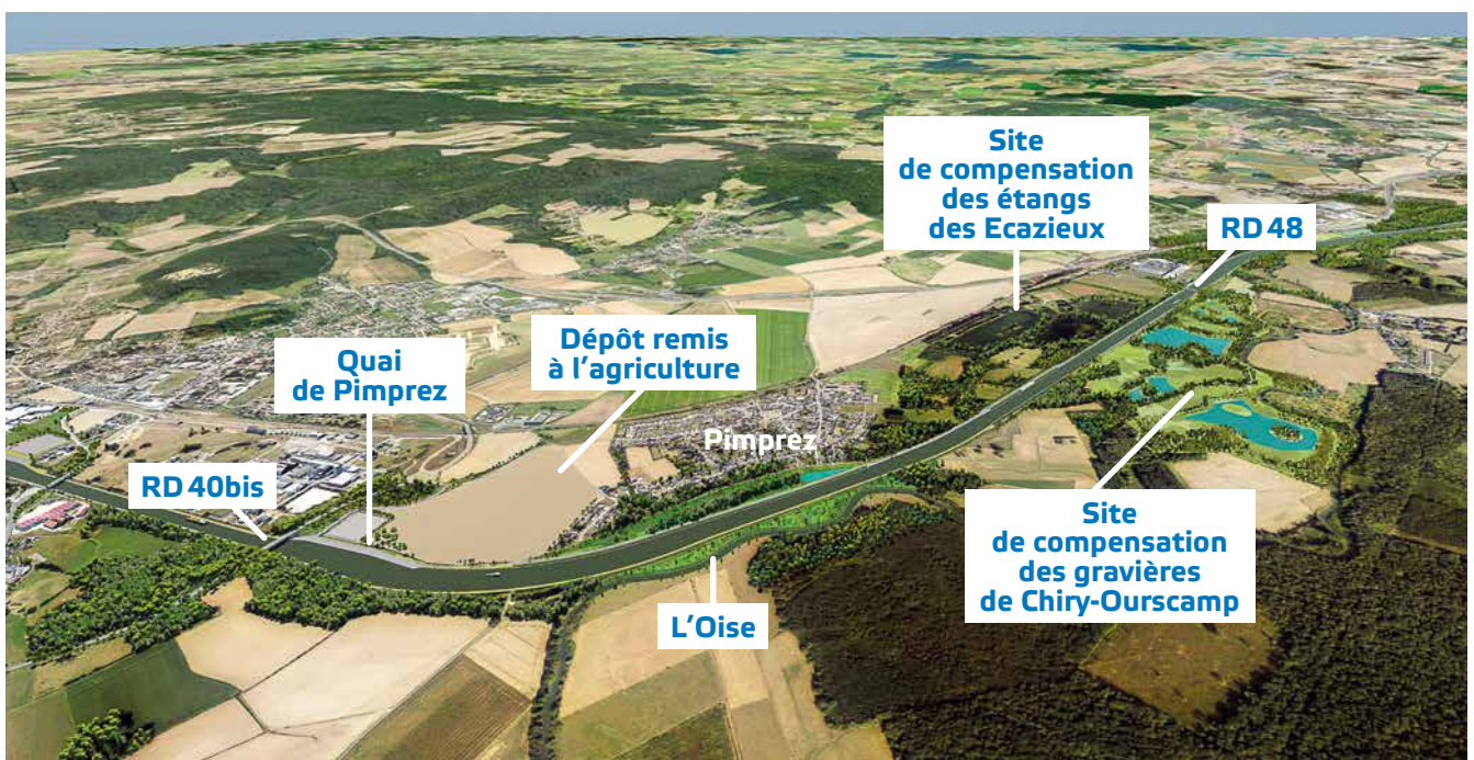
Vue 3D du Canal et ses aménagements

Le ru du Moulin et le ru Lannois continueront de s'écouler sous le Canal grâce à deux ouvrages souterrains appelés siphons , permettant aux cours d'eau de rejoindre ensuite leur lit naturel jusqu'à l'Oise. Enfin, au sud de l'ancien tracé de l'Oise, un déversoir permettra de réguler le niveau de l'eau sur la section du Canal entre Montmacq et Passel.